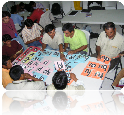
Se utiliza en el departamento de Sacatepéquez

En Guatemala se ha realizado la aplicación del método Estrellita para la alfabetización, en el departamento de Sacatepéquez. Para ello se ha realizado la adaptación correspondiente en las imágenes que se utilizan, creando material didáctico de apoyo, asignando un color para la elaboración de las tarjetas de las ristas, tamaño adecuado para las letras y figuras. Se han realizado capacitaciones al personal que está a cargo del proceso, propiciando la creación de rimas, cuentos y canciones.